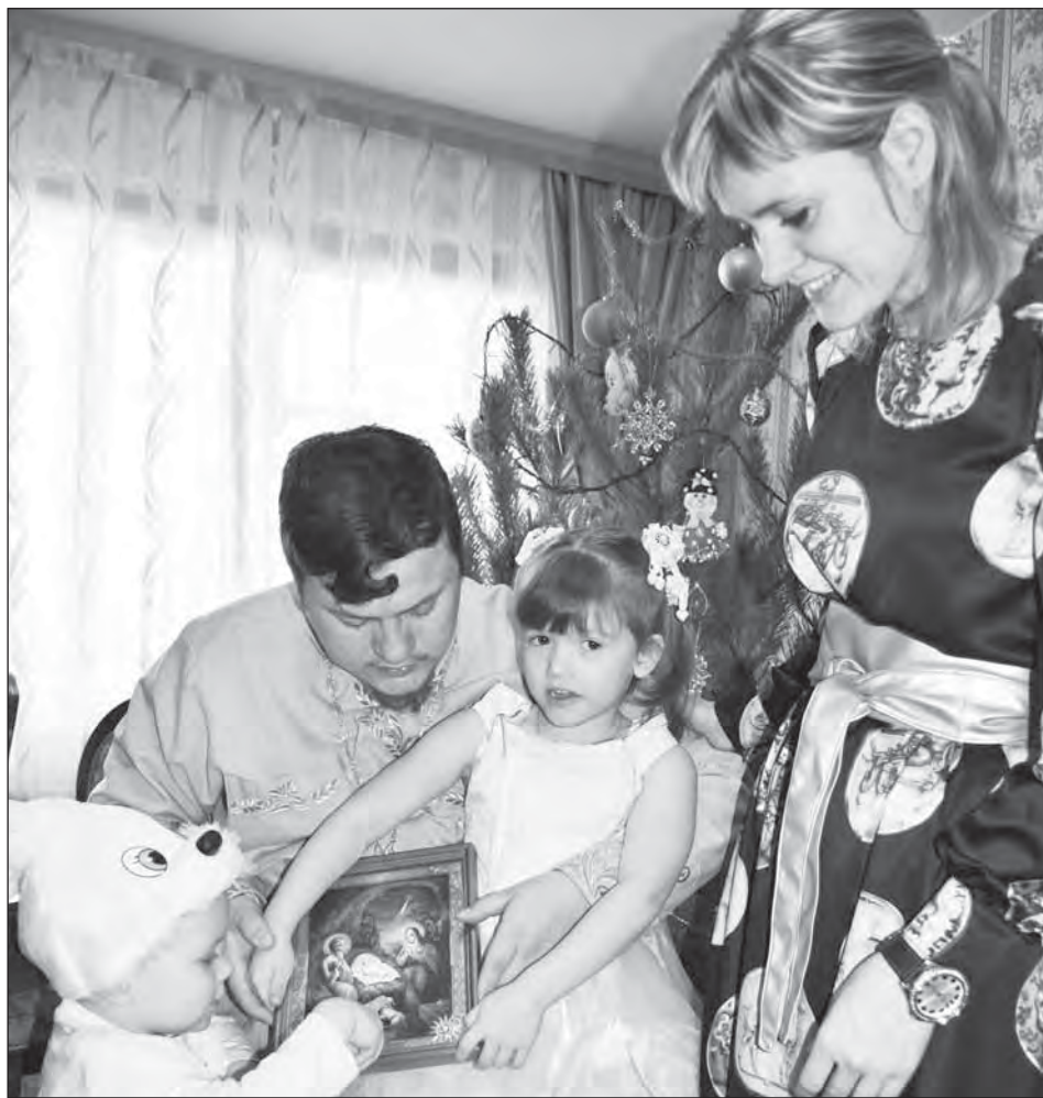
■ Икона Рождества Христова – одна из самых почитаемых в этом доме

– Нет, продолжается до самого Крещения Господня. Всю Святочную неде-